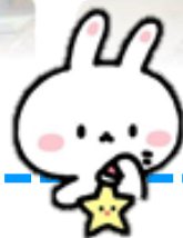
◎ 可愛的玉兔下凡來玩耍。